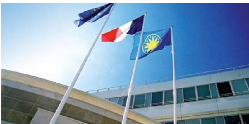
Syndicat d'Agglomération Nouvelle de Sénart.

L'ECOPOLE s'inscrit dans un projet européen piloté par le SAN de Sénart : ENCOURAGE, visant en particulier à mieux prendre en compte l'environnement dans les parcs d'activités.