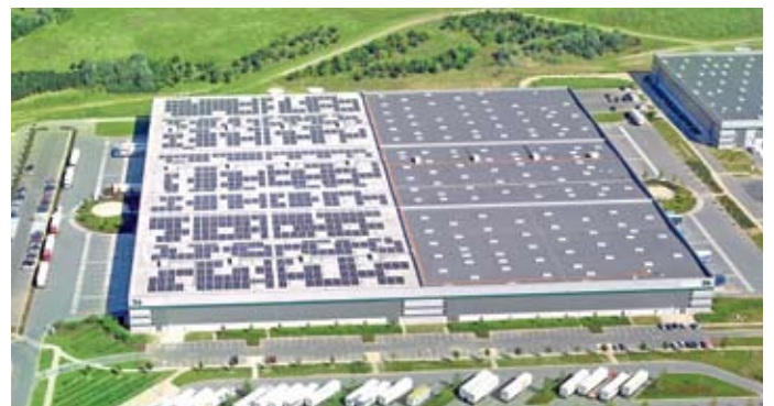
Les bâtiments Prologis couverts par 10 000 m 2 de capteurs photovoltaïques.

Prologis , implanté sur le parc de Chanteloup, à Moissy-Cramayel, a signé la charte QE, applicable à l'ensemble de son site de 250 000 m 2 . Aujourd'hui, 10 000 m 2 de toiture intègrent des capteurs photovoltaïques pour une production de 446 kWc.