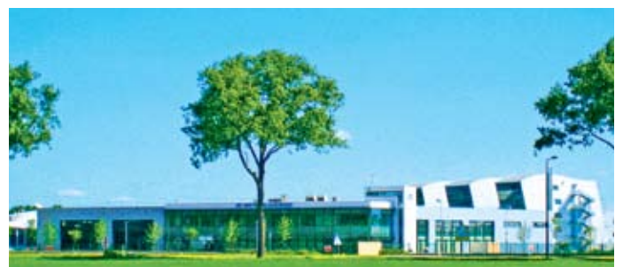
Martinenq Imprimerie – Parc du Levant.