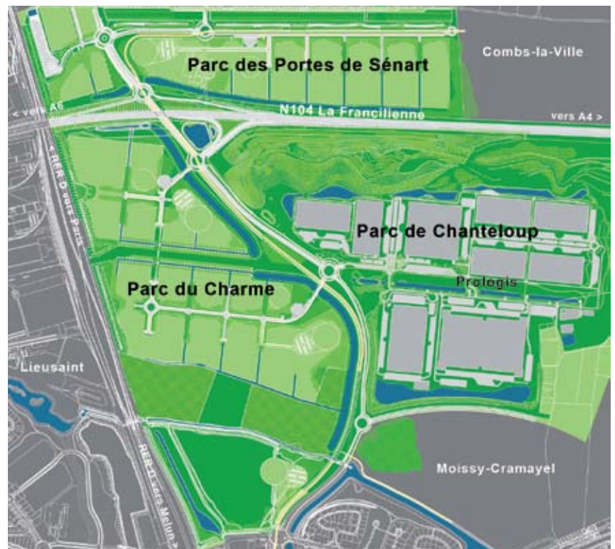
Développé sur trois communes, l'Ecopôle représente un ensemble fonctionnel de 300 hectares, avec 2 nouveaux parcs d'activités qui s'appuient sur le parc existant de Chanteloup.

Pour la réalisation de ce parc d'activités qu'elle souhaite exemplaire, la ville nouvelle s'est donnée des objectifs ambitieux, et a conduit différentes études afin d'aboutir à un projet qui intègre dans sa conception, sa mise en œuvre et sa gestion, les objectifs du développement durable.