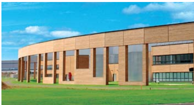
Samada : les bâtiments ont fait l'objet d'une recherche architecturale poussée, dans un souci d'esthétisme et de respect de l'environnement.

Samada , filiale du groupe Monoprix, a implanté l'une de ses activités logistiques sur le parc de la Borne Blanche (Parisud 6) à Combs-la-Ville. Ici encore, le respect du cahier des charges QE : tri sélectif des déchets et des cartons, gestion des eaux.