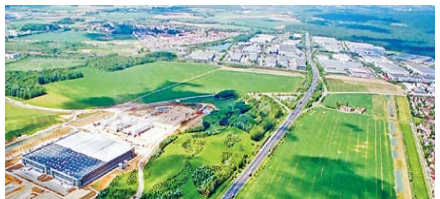
Au nord de la Francilienne, le parc des Portes de Sénart et au sud, les parcs de Chanteloup et du Charme.